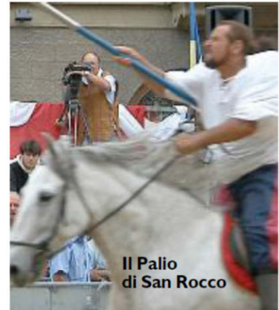
Il Palio di San Rocco