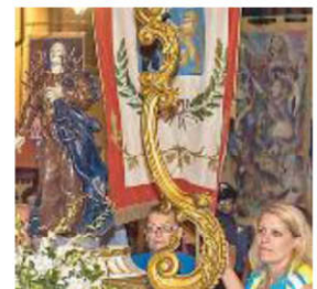
CONTINUANO i festeggia...

Perdono e Palio La festa continua fino a martedì