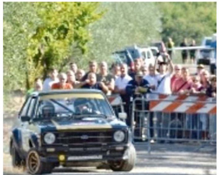
Sale l'attesa per il Rally di Reggello

DOMANI dalle 14 alle 18 sarà chiusa la provinciale 1 Aretina per San Donato (via Fiorentina) all'altezza della scuola elementare di Troghi per il rifacimento del tetto della don Lorenzo Milani. Percorsi alternativi: da Incisa, strada comunale del Pian dell'Isola; da Firenze-Bagno a Ripoli, bivio del Focardo-Bombone-Le Corti.