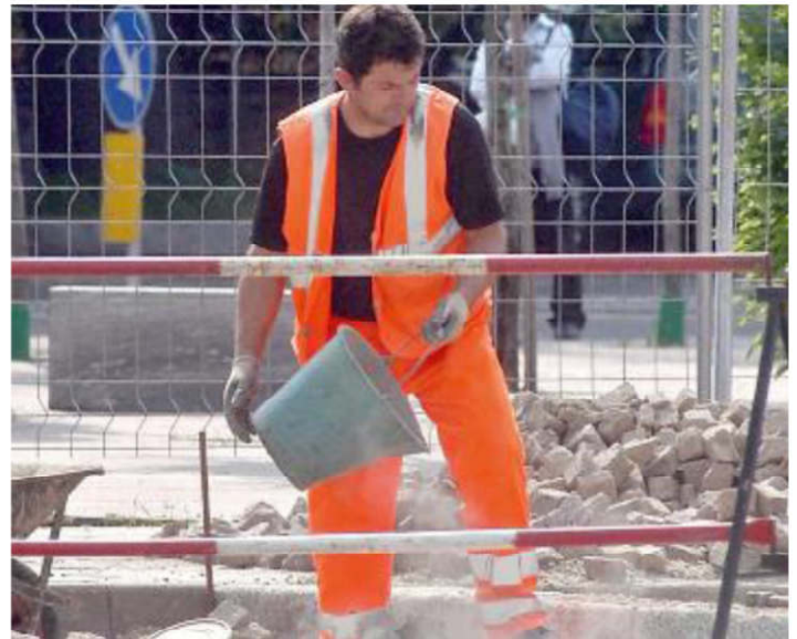
Il Comune investe per gli interventi sulle strade altri 78mila euro

PER quanto riguarda l'abbattimento delle barriere architettoniche, cantieri urbani ancora in movimento fino a fine settembre su quattro delle sei strade interessate da un progetto partito a giugno scorso per un investimento di oltre 40mila euro